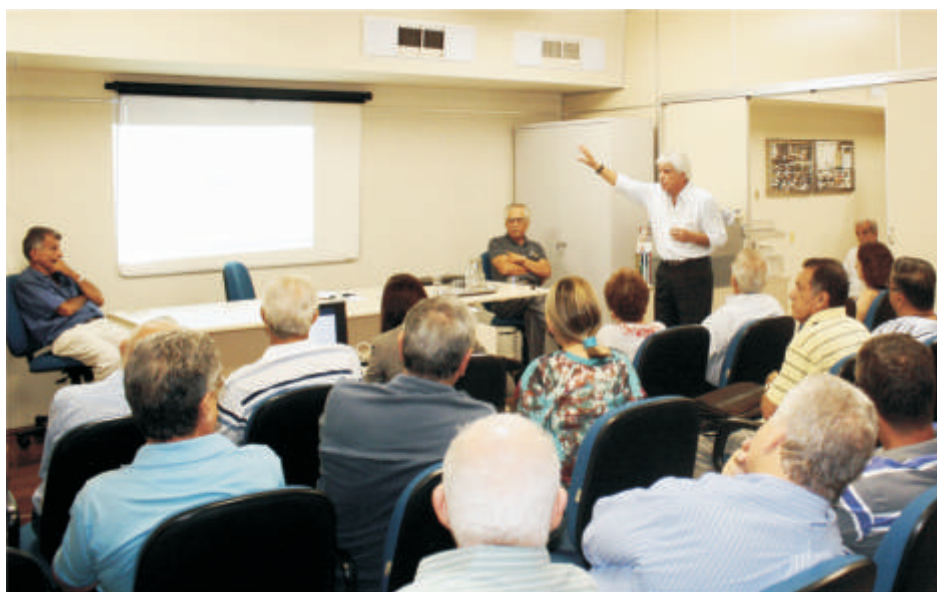
A Diretoria da Braslight apresentou a Conselheiros e Diretores detalhes do distrato