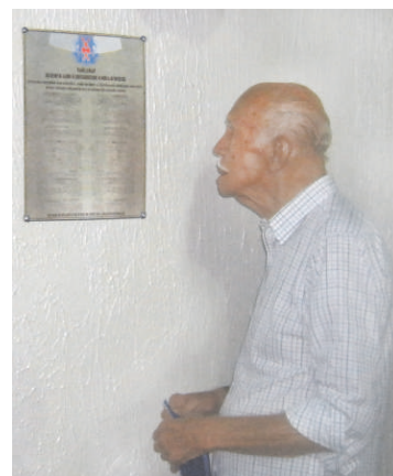
Oswaldo Cruz junto à placa com seu nome

A excursão ainda incluiu uma visita ao Centro de Vasouras, onde os associados fizeram compras de produtos regionais, e uma noite de seresta e serenata em Conservatória.