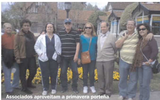
Associados aproveitam a primavera porteña

Voltaram todos satisfeitos, elogiando muito mais este passeio da APB.