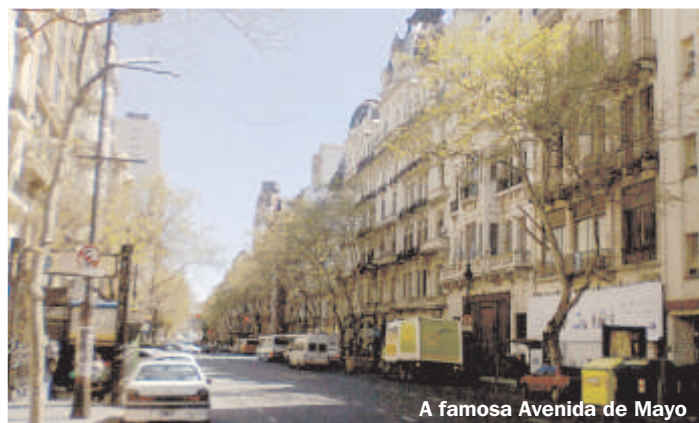
A famosa Avenida de Mayo