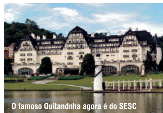
O famoso Quitandinha agora é do SESC

Turismo – uma rede de hotéis no Brasil inteiro. No Rio, você pode escolher