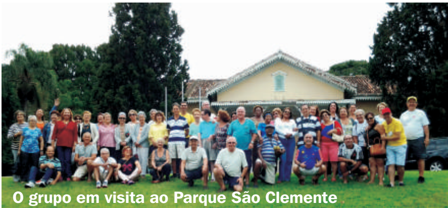
O grupo em visita ao Parque São Clemente

A manhã de domingo foi preenchida por uma caminhada no Parque São Clemente, com a participação de guias locais. O grupo também visitou a Igreja de Nossa Senhora das Graças e a fábrica de bolsas Ana Ricci, e ainda fez um passeio pelo centro histórico local.