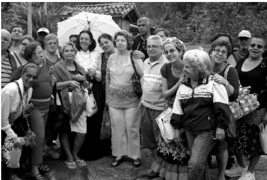
Associados são recebidos na fazenda São João da Prosperidade

A sede da COFEL – Colônia de Férias dos Empregados da Light, em Vassouras, foi onde se instalaram os associados visitantes, em acomodações confortáveis e com